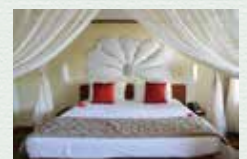
エスコ・ザルーのお部屋