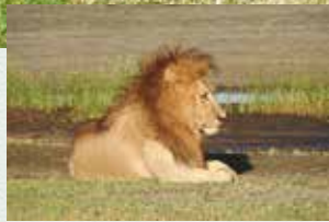
くつろぐオスライオン